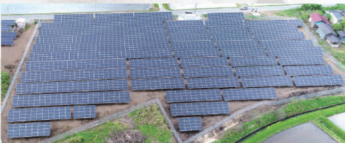
西尾木材岩手県中谷内発電所 (723kW)