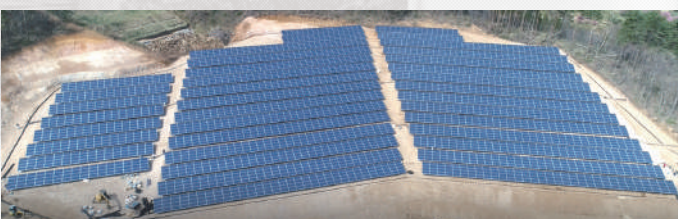
ウエストランバー福島県蛇音山発電所 (1290kW)

太陽光発電所を順次設置、稼働させることにより、SDGsの目標7（エネルギーをみんなに、そしてクリーンに）の達成に貢献するとともに、脱炭素社会の実現、地球温暖化防止に向けて取り組んでいます。