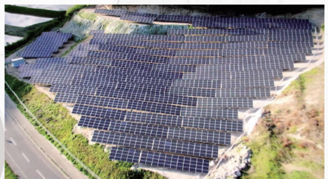
西尾木材岩手県堀切発電所 (933kW)