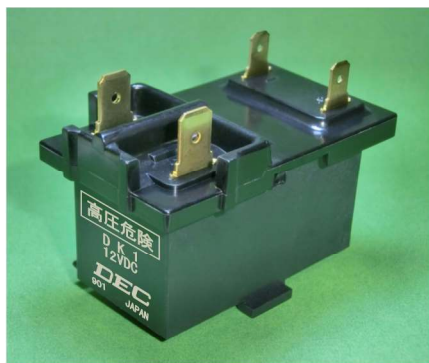
DK1 (高電圧用、タブ端子型)