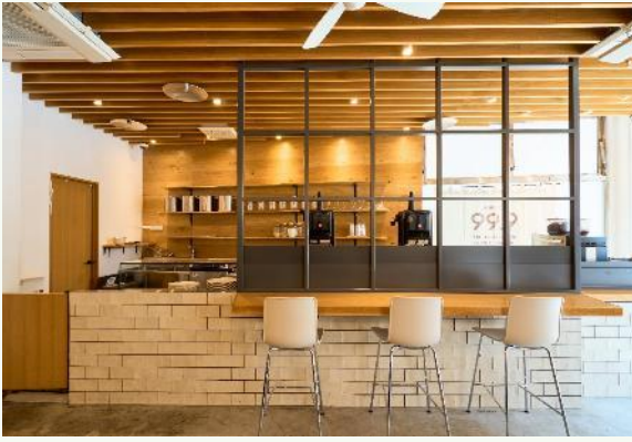
おいしい氷屋 天神南店 福岡市中央区渡辺通 5-14-12