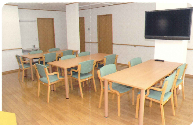
床暖房で冬もポカポカ