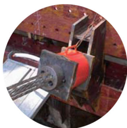
バックアンカー軸力計測