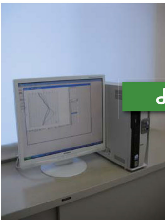
パソコンによる自動計測状況