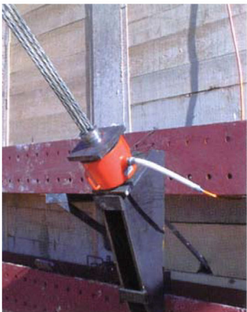
バックアンカー軸力計設置状況