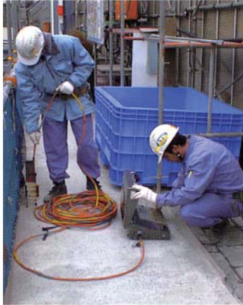
山留め壁の変形計測状況