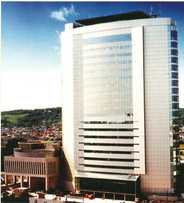
高崎シティーホール