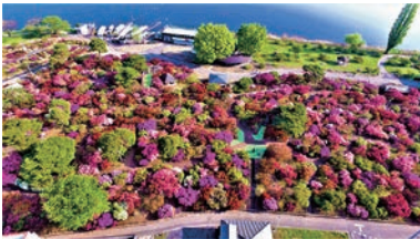
▲つつじまつりの様子

当日は、つつじまつり会場での人力車体験や江戸幕府鉄砲百人隊の演武をはじめ、茂林寺周辺ではキッチンカーやワークショップが楽しめる「茂林寺沼フェスタ」が開催されるなど、沿線の見どころが満載です。フェスタ内の「寄席 in 茂林寺」では伝統芸能の落語も披露され、会場を賑やかに盛り上げます。ぜひワンコインの乗車券を手に、魅力あふれる春の館林をゆったりと巡ってみませんか。