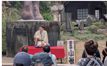
▲茂林寺沼フェスタの様子