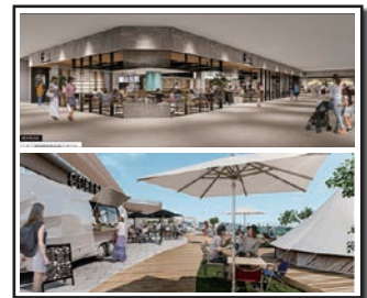
(手掛けている新業態店舗イメージ)