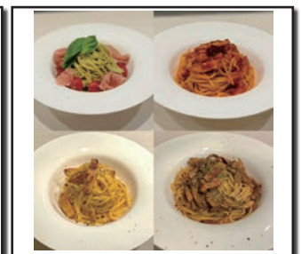
(豊富なメニュー展開)