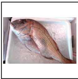
(代表自ら仕入れを行う)