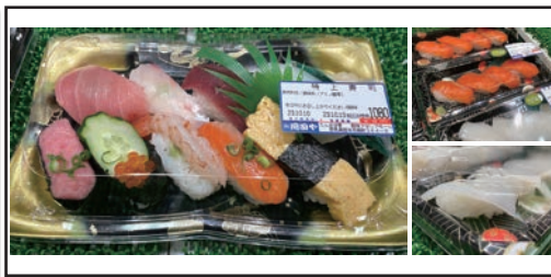
(新鮮で大ぶりなネタが自慢)