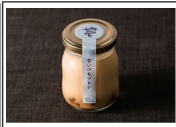
(大人気メニューの芋いつもプリン)