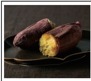
(焼き方にもこだわった焼き芋)

含み、カロリーはお米や小麦と比べて3分の1程度と体に優しい食べ物であること、なにより「さつまいも」は昔から愛されている定番中の定番であることが大きな決め手だった。同社では定番ではあるが、ある意味地味な「さつまいも」をどうやってブランディングしていくかに注力し商品開発を行なった。提供する商品、ロゴや店舗デザインも徹底し「さつまいも」の良さを維持しつつも洗練されたものへと構築している。商品もさることながらセンスを感じるお店だ。一度行ってみたいはいかがだろうか。