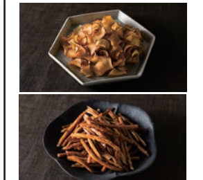
(こだわりの商品たち)