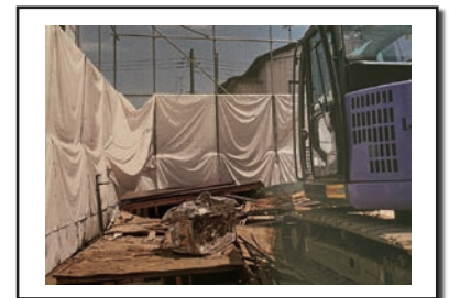
(重機による解体の様子)