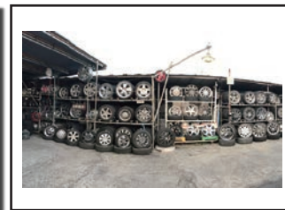
(数多くのタイヤが並ぶ)