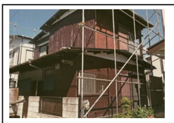
(単管パイプ組上げ)

新部社長は「解体で悩んでいる人は不動産でも悩んでいるのでお客様からは一つの窓口でいっぺんに話ができるので便利だと言われます」と話す。解体を自社でこなしていることでコストを抑えられるのも強みだ。また顧客と直接やりとりを行い細かい要望を社員としっかり管理共有できるので顧客との齟齬がないこともまた強みと言える。「今後もさらに不動産仲介業と家屋解体の柱を太くしていきたい」と話す。