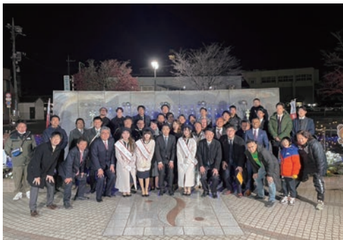
(▲ 参加者の集合写真)

12月2日(土)、館林駅東口駅前ロータリーにて、館林 YEG「12月例会 たてばやし光のページェントイルミネーション点灯式」を開催し、青年部員35名、多田市長や正田会頭を始めとする多