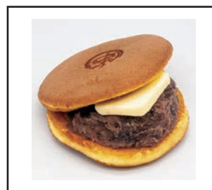
（こだわりの詰まったどら焼き）