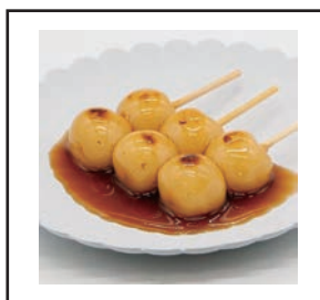
（「二段熟成醤油」を使用したみたらし団子）

「二段熟成醤油」をふんだんに使用したみたらしたれ（みたらし団子）、餡に正田醤油の濃口醤油を使用したどら焼き、この餡は市内の和菓子店（晃明堂）に特注品で作っているもので甘さ控えめ。皮は、オリジナル配合の粉を店内で焼き上げており、もちもち食感が特徴。これらのメニューは「醤油屋」としてのプライドを強く感じる。1月2日からは季節限定メニュー「ストロベリーチョコ生どら」（写真）の提供を開始した。今後限定メニュー、新商品を積極的に提供していくという。