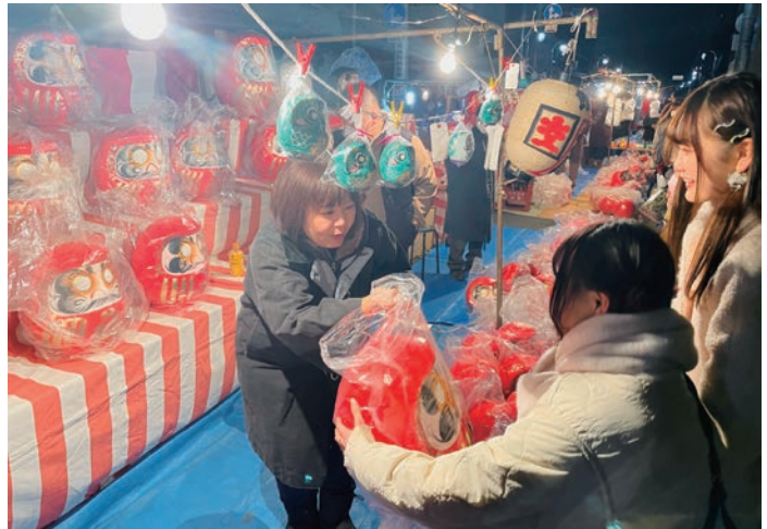
（▲ ダルマを求める来場者たち）

開催130年以上の伝統を生かし、市繁栄と産業振興を図ろうという初市は、コロナ以前は仲町からかごめ通りにかけて実施してきたが、本年は会場を昨年と同様の仲町交差点周辺の総延長150メートルで実施した。会場には、だるま商や飲食の屋台37店が軒を連ねた。