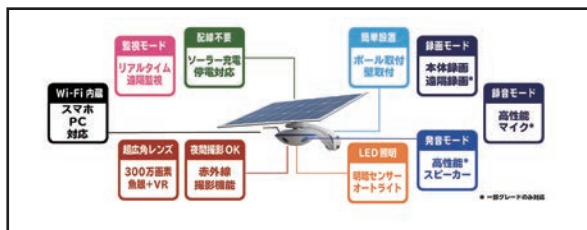
(ソーラーLED付防犯カメラの特徴)

ネット接続型モデルでは本体の録画画像をスマートフォン・パソコンを通して遠隔からも見ることができる。また最上位グレードは被害を未然に防げるように「発声機能」がついており音声で警告することができる。これらの機能は実用新案に登録されている。防犯意識も高まってきた近年、防犯カメラの設置でさまざまな犯罪の解決につながっているのも事実。防犯カメラの設置が自社を守ること以外に監視的役割で社会に貢献しているといえよう。