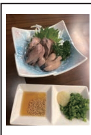
(鳥のゆでレバ刺し)