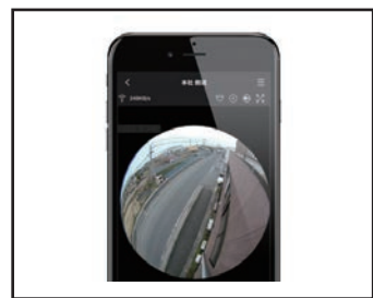
(遠隔からも見ることができる)