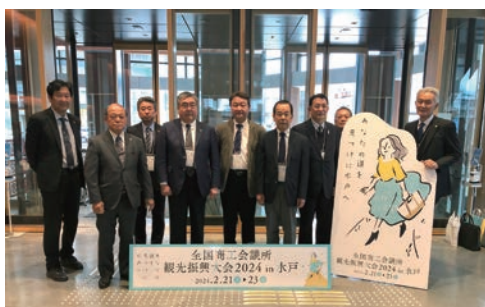
（▲参加者の集合写真）

水戸市民会館で開催された「全国商工会議所観光振興大会2024 in 水戸」全体会議に、正副会頭・専務理事・議員等10名が参加した。