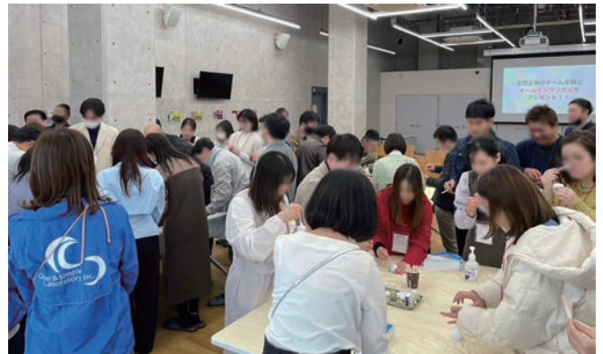
(▲(株)シーエスラボでのハンドクリーム作り)