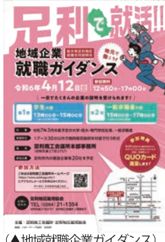
(▲地域就職企業ガイダンス)