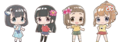
館林アニメアソシエーター