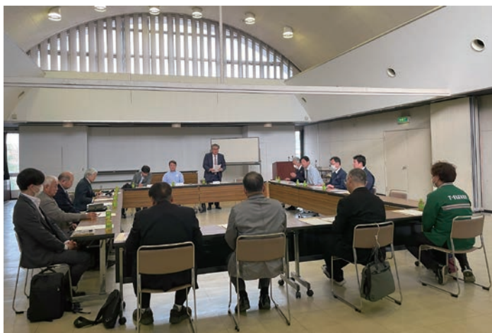
(▲食品観光部会・観光物産委員会合同会議の様子)

コロナ後の資金繰り・事業承継・人手不足・中心市街地活性化・産業人材育成の課題など重点推進事業を含む令和6年度事業計画について協議、この原案は収支予算と共に3月12日開催の常議員会、3月28日開催の通常議員総会に提案し審議される。