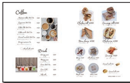
(併設されたカフェのメニュー)

ていたことから新店の内装はすべてご主人が担当した。飲食スペースとネイル施術スペースは完全に塞がず、明るさも確保しながら、どちらもお互いが気にならないくらいにほどよい開放感のある空間を作っている。カフェで提供するメニューはキッチンカーで人気のものだが、お店で初めて提供するチチャロン（700円税込）は豚肉を揚げ焼きしてさつまいもアヒというピリ辛ソースを絡めた南米ペルーの朝食で親しまれているもの。ネイル以外にもカフェでも楽しめるお店だ。