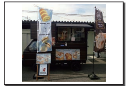
(キッチンカーでの出店も行う)