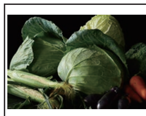
(独自のノウハウを用いて作る野菜)