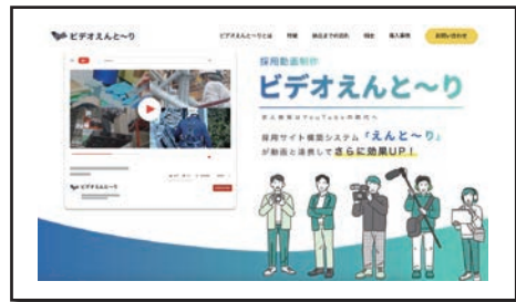
(同社が手がける求人動画サービス)