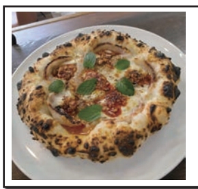
(本格的なピッツァを提供)