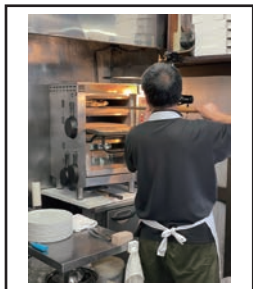
(1枚1枚丁寧に作りこんでいる)