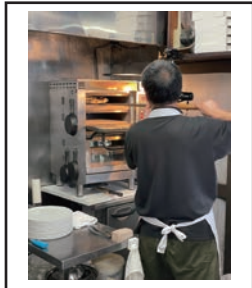
(1枚1枚丁寧に作りこんでいる)