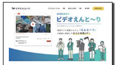
(同社が手がける求人動画サービス)