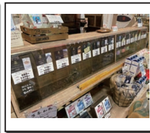
(様々なコーヒー豆を販売)