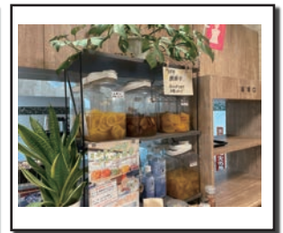
(ミネラル発酵ドリンクの販売も開始)