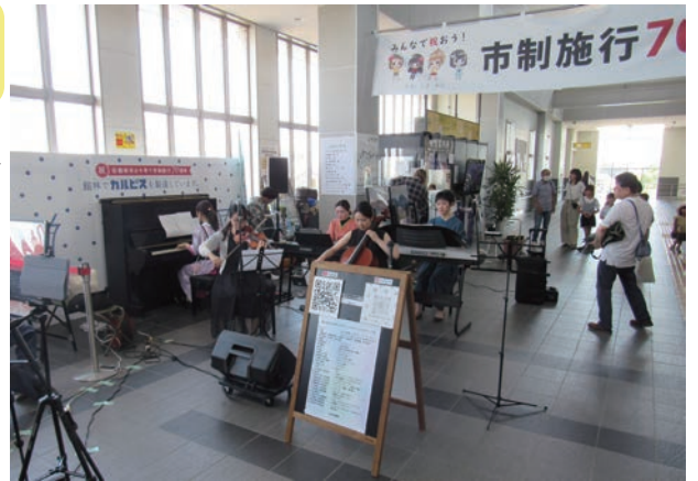
(▲ストリートピアノフェスティバルの様子)