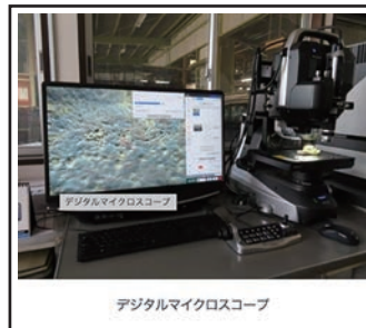
デジタルマイクロスコープ