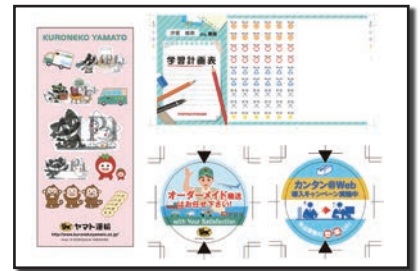
(同社が手がけたデザインの数々)