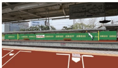
▲新桐生駅装飾イメージ

野球を起点としたイベントやセミナー、展示など様々な企画を展開するほか、今後は東武鉄道・新桐生駅の副駅名を「球都桐生」とし、野球場をモチーフにした駅構内装飾にも着手、「野球のまち」桐生のさらなるPRを図る。