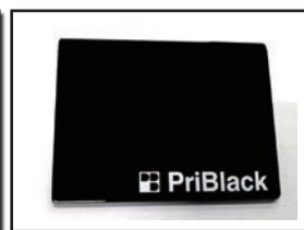
（自社で開発された「PriBlack」）