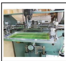
（曲面スクリーン印刷機）