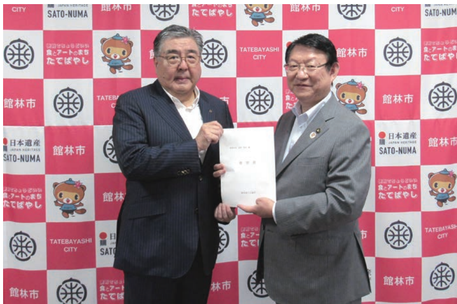
▲多田市長に要望書を手渡す正田会頭（＝左）