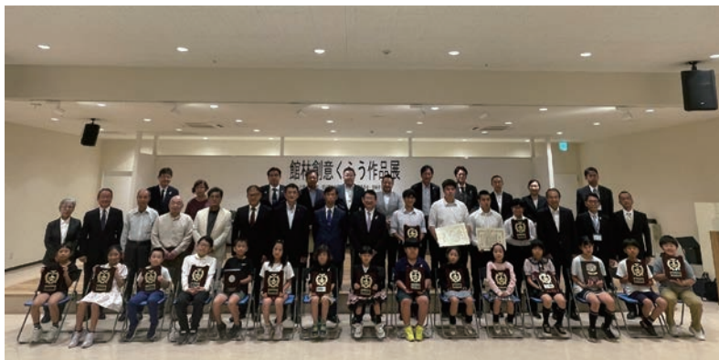
▲表彰式での集合写真

10月4日(金)には同会場にて表彰式が開催され、入賞者達に賞状と記念品が手渡された。その他入賞作品は右記の通り。