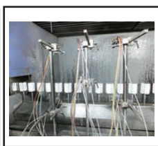
（スピンドル塗装ライン）