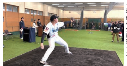
◀球都桐生野球ラボ

国内でも類を見ない廃校を利活用した最先端かつ多様な「野球ラボ」環境として2024年3月に開設。国内屈指の科学的な測定環境を揃え、投球や打撃などの動作解析に加えて、全競技者の身体能力を数値化できるサービスを提供。測定した数値や蓄積したデータから科学的根拠に基づいた指導・助言が受けられ、野球をはじめ、他のスポーツでもケガなく長く楽しめるためのサポートを展開する。