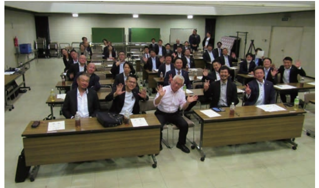
▲例会後の集合写真