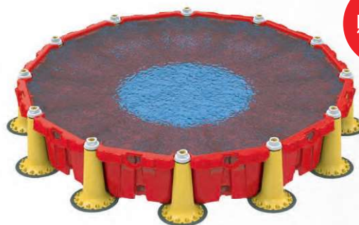
漏水の貯留・緊急備蓄用水(ブルーシート併用推奨)