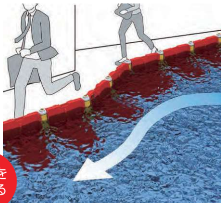
避難道路の確保に