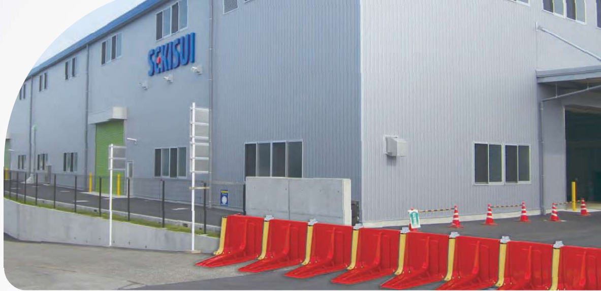
工場施設の浸水対策に