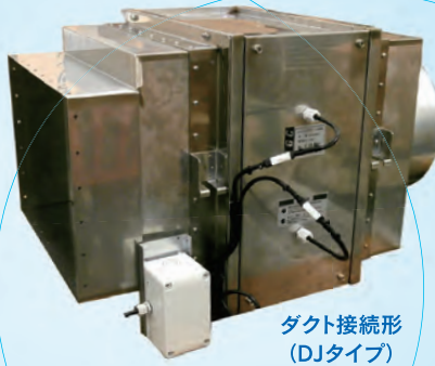
ダクト接続形 (DJタイプ)