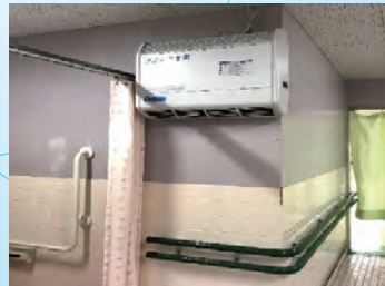
特養施設内トイレ