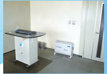
オフィス内喫煙室