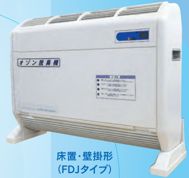
床置・壁掛形 (FDJタイプ)