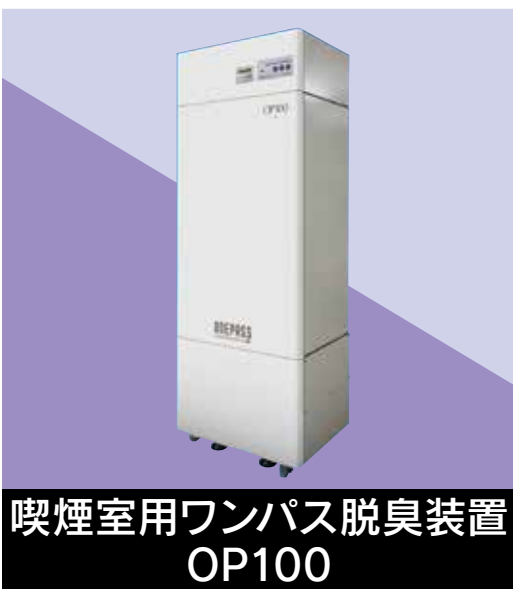
喫煙室用ワンパス脱臭装置 OP100