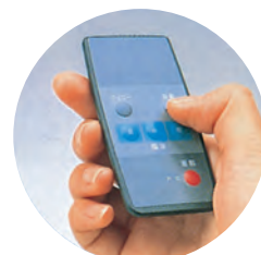
ワイヤレスリモコン