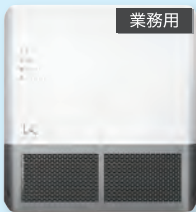
光触媒 除菌・脱臭機 壁掛けタイプ