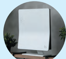
<別売り>専用スタンド