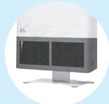
<別売り>専用スタンド