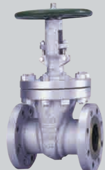
クラス300 4 B 鋳鋼ゲート弁