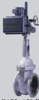
クラス150 12 B 鋳鋼電動弁