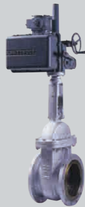
クラス150 12 B 鋳鋼電動弁