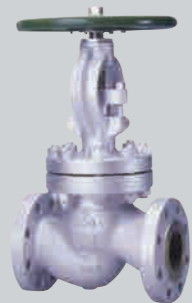
クラス300 4 B 鋳鋼グローブ弁