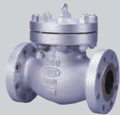
クラス300 4 B 鋳鋼チェッキ弁