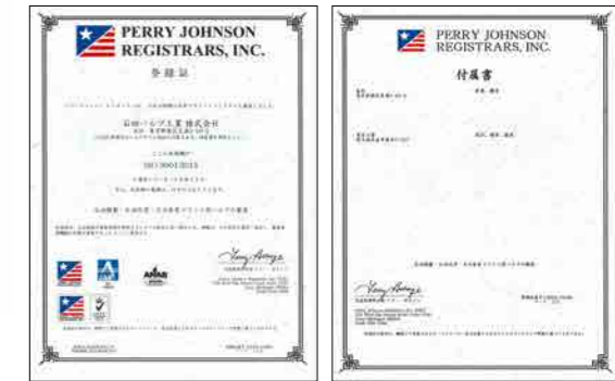
本 社 及 び 東 京 工 場

ISO9001:2000 認証取得、2008年8月 ISO9001:2008 認証取得、2009年8月 ISO9001:2015 認証取得、2017年4月 ISO9001:2015 認証取得、2020年8月