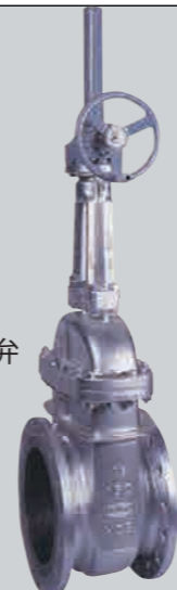
クラス150 16 B 鋳鋼ギヤ操作弁