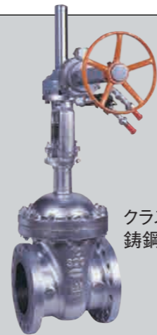
クラス300 10 B 鋳鋼空気圧モーター操作弁