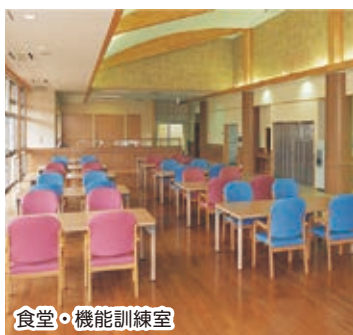
食堂・機能訓練室