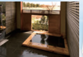
【貸切風呂】カップルやファミリーに人気の貸切風呂は全タイプ源泉かけ流しの温泉!