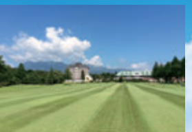
那須連山を背にしたホテル&クラブハウス。ゼブラ模様も美しいですね。