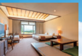
ハワイ島から直輸入した家具を配したアジアンテイストルーム。オリエンタルな雰囲気にも癒されます。