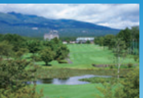
青空の下、目の前の那須連山を眺めると、この眺望だけでも一見の価値あります。