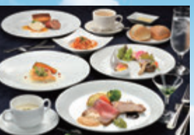
季節ごと変わるフレンチコース。栃木県産和牛をメインとしたお食事をご用意。