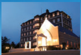
那須高原の雄大な自然の中に行む、英国貴族の別荘を模した潇洒な建物。