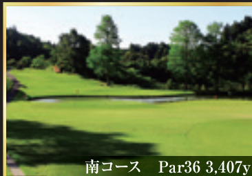
南コース Par36 3,407y