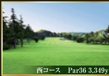
西コース Par36 3,349y