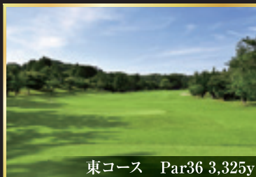
東コース Par36 3,325y