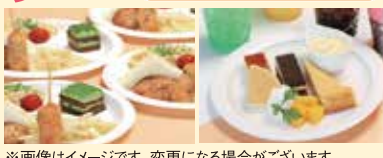
※画像はイメージです。変更になる場合がございます。

全日上記カレンダー料金にプラス料金でパーティ付きへ変更できます。 +1,430円(税込)で軽食&ソフトドリンク 期間:1/1~3/31 +1,100円(税込)でケーキセット&ソフトドリンク +550円(税込)でソフトドリンク コンペ賞品のご依頼も受付中!