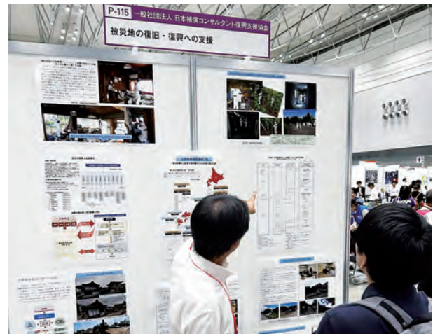
— ぼうさいこくたい 2025 in 新潟でのパネル展示の様子 —

また、協定締結自治体をはじめとする関係機関からの要請に基づく公費解体関係業務に関する研修講師の派遣など技術協力に努めています。