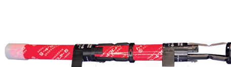
▲連続してご使用になる場合