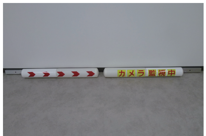
芯材：マグネシウム合金 緩衝材：エアバルーン