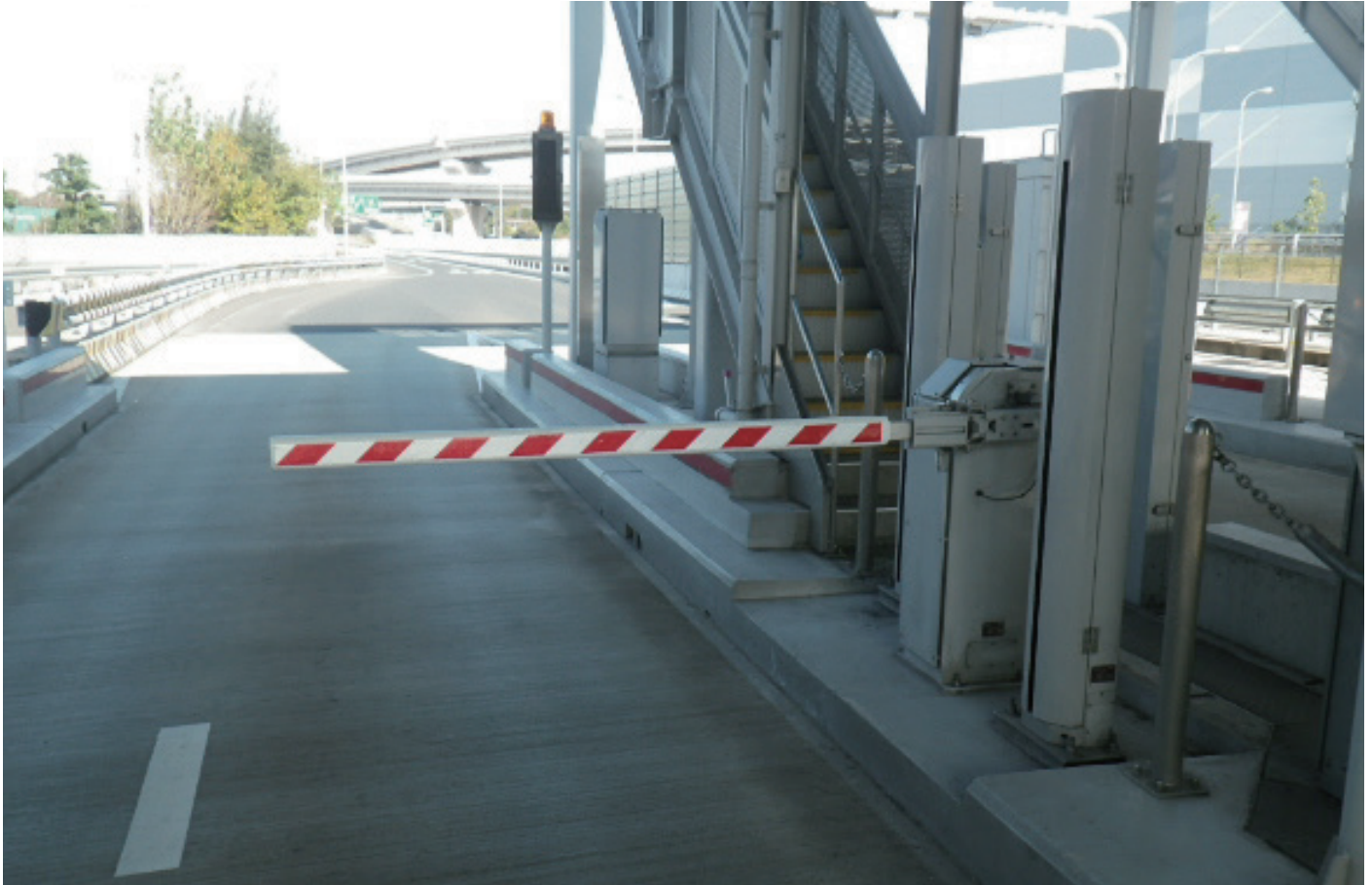
阪神高速道路 湾岸線

取付部のアタッチメントゴムで多種の機器に対応します。車両接触部に、ポリエチレンフォーム・エアバルーン等を使用し、必要な長さへの重量調整が可能です。バー本体に反射シートでゼブラ模様、コメント等を表示出来ます。