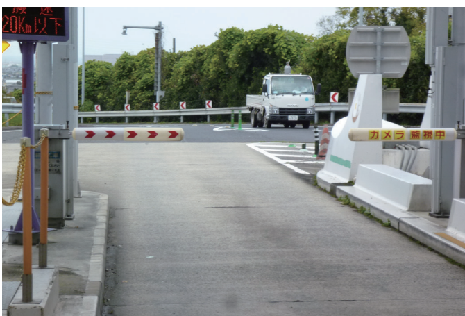
阪和自動車道 泉南IC