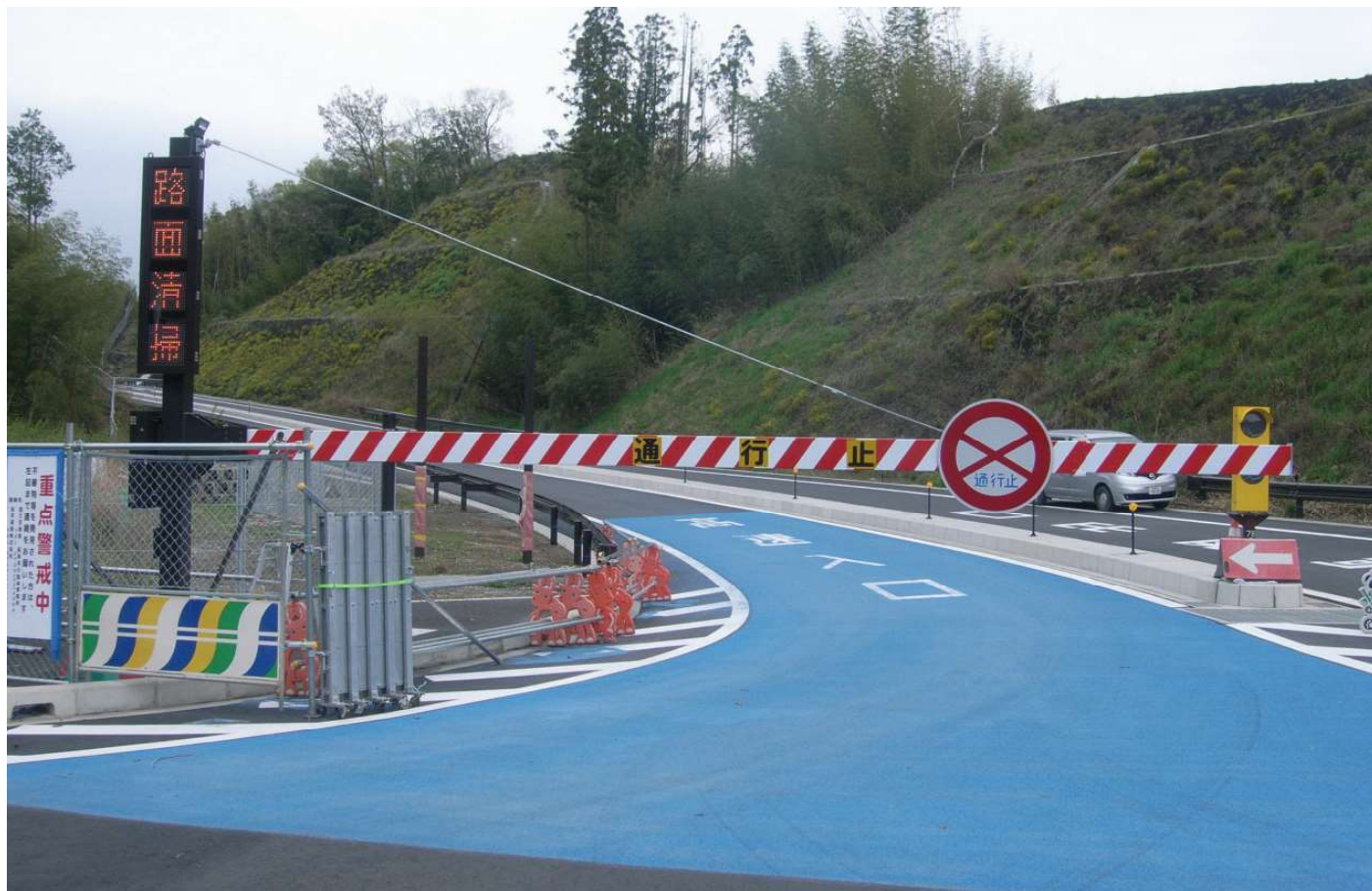
紀勢自動車道 上富田 IC

通行止標示アームがアルミ製で軽量のため、緊急時の対応が迅速に行えます。又、手動式のため災害時の停電等にも影響されず、非常用電源が不用です。現地測量、本体設計から設置まで実施させていただきます。