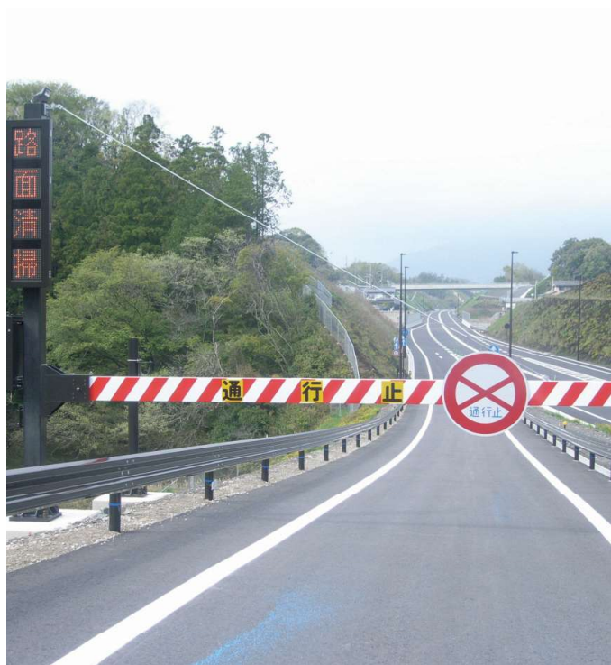
紀勢自動車道 南紀白浜IC