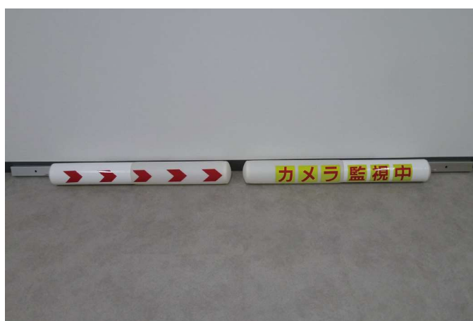
芯材：マグネシウム合金 緩衝材：エアバルーン