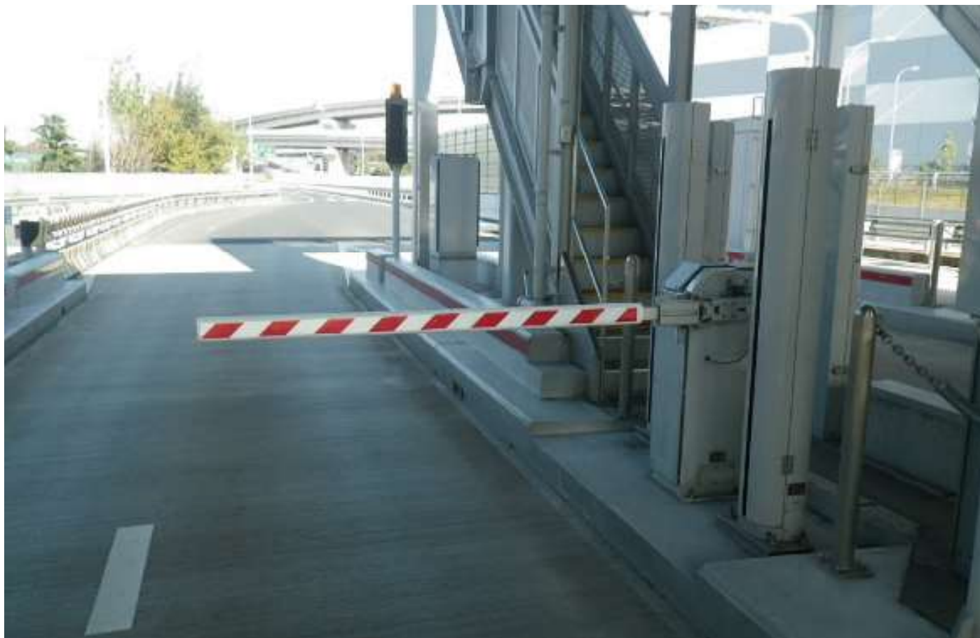
阪神高速道路 湾岸線

取付部のアタッチメントゴムで多種の機器に対応します。車両接触部に、ポリエチレンフォーム・エアバルーン等を使用し、必要な長さへの重量調整が可能です。バー本体に反射シートでゼブラ模様、コメント等を表示出来ます。