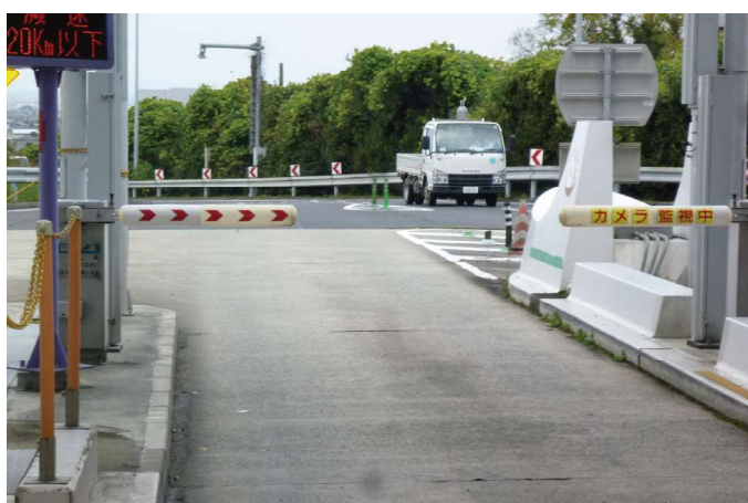
阪和自動車道 泉南IC