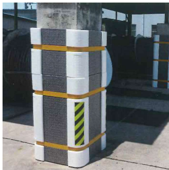
工場や構内の安全対策に。