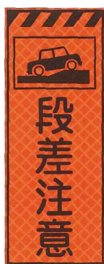
段差注意 JP-001 ●