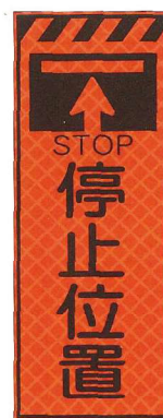
停止位置 JP-010 ●