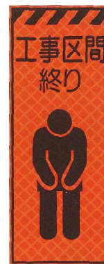
工事区間終り JP-025 ●