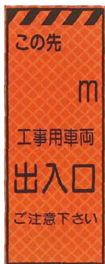
〇〇m先車両出入口 JP-026 ●