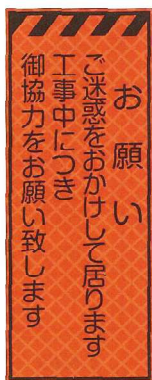
お願い JP-011 ●