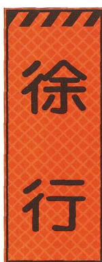
徐行 JP-002 ●