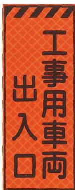
工事用車両 出入口 JP-018 ●