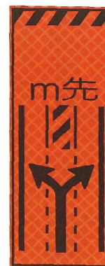
車線減(両矢) JP-033-03 ●