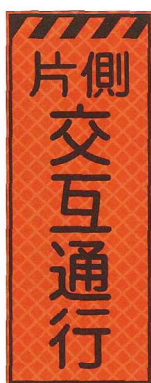
片側交互通行 JP-004 ●