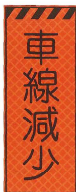
車線減少 JP-033 ●