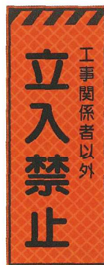
立入禁止 JP-019 ●