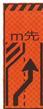
車線減(右矢) JP-033-02 ●