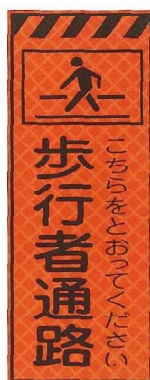
歩行者通路 JP-028 ●