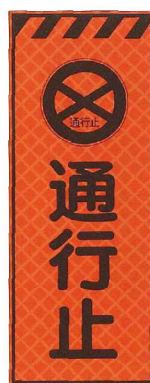
通行止 JP-005 ●