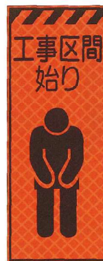
工事区間始り JP-024 ●