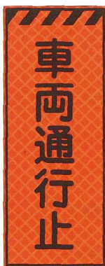
車両通行止 JP-012 ●