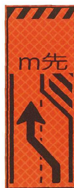
車線減(左矢) JP-033-01 ●