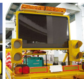
<SS3215Fシリーズ(5文字3段)> 荷台固定タイプ