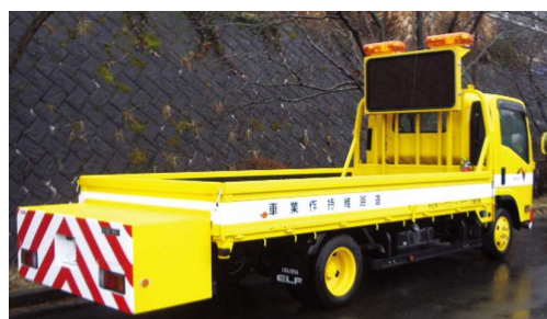
<WD320-142シリーズ(4文字2段)> 鴨居タイプ