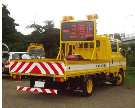
<SS328Fシリーズ(4文字2段)> 荷台固定タイプ