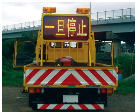
<SS328F シリーズ (4文字2段)> 荷台固定タイプ

作業車の荷台に搭載できる大きさで、遠くからでも認識できる320mm角の表示板を使用しています。荷台に固定するタイプと、鴨居に固定するタイプがあり、お客様のご要望にお応えいたします。表示面は、強化ガラスを使用していますので、視認性、耐久性にも優れています。取り付け位置によっては、荷台固定タイプ(SSタイプ)、鴨居取り付けタイプ(WDタイプ)の二種類があります。