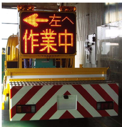
<SS3215Fシリーズ(5文字3段)> 荷台固定タイプ