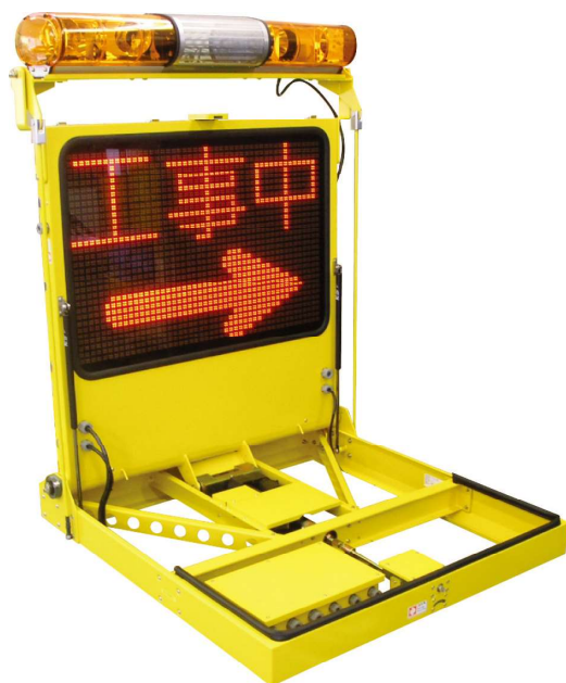
<搭載前の本体形状>

遠くからでも視認性が高い、320mm角の表示板を使用した起立タイプの標識装置です。緊急時には素早く起立し、後続車へいち早く注意喚気を行い、事故の防止に役立ちます。外観は薄型設計なので、車両美観を損なうことは御座いません。(*1)