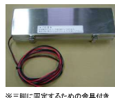
電池ボックス ※三脚に固定するための金具付き