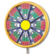
クラッシュガード装着時