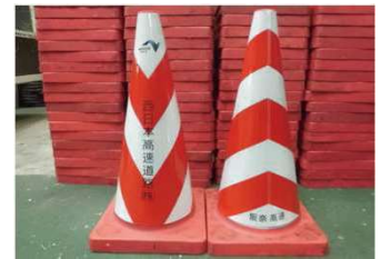
コーンカバー貼替