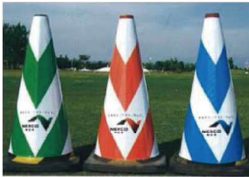
各種デザイン製作承ります。