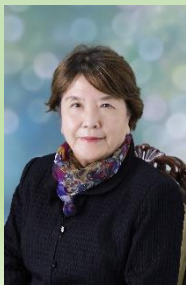
株式会社 ケアサービス伊東 代表取締役社長