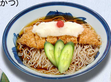
冷 勝おろしそば 1,460円 (税込1,606円)

冷 勝おろしそば……………1,460円 (税込1,606円) やわらかとんかつ (コースかつ、又はヒレかつ)