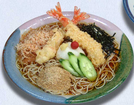
冷 えびおろしそば 1,760円 (税込1,936円)