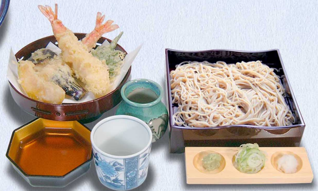
天箱そば 大えび天2本…2,090円 (税込2,299円) 大えび天1本…1,760円 (税込1,936円)

当店自慢のおそばは 北海道江丹別より毎日空輸で 送られてくるそば粉でお打ち いたしております 挽きたて、打ちたて、茹でたて 三たて のおそばの風味を十分 ご堪能下さいませ