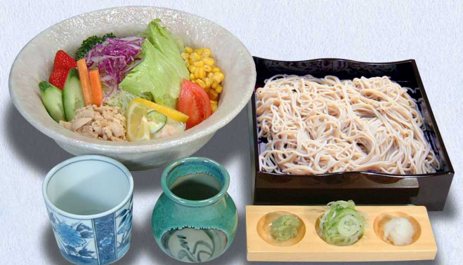
サラダ箱そば…1,540円 (税込1,694円)

サラダ箱そば……………1,540円 (税込1,694円) とろろ箱そば……………1,540円 (税込1,694円)