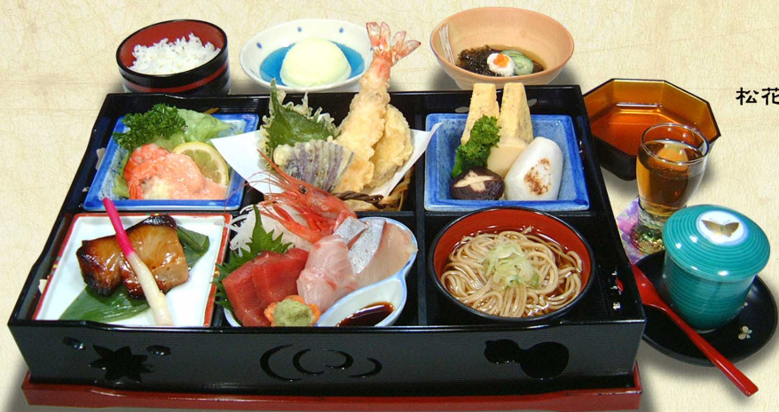
松花堂弁当“雅 みやび”…2,980円(税込3,278円)

松花堂弁当 “雅 みやび”…2,980円(税込3,278円) 食前酒またはオレンジジュース 大えびと野菜の天ぷら お造り4点・焼物 焚き合わせ・サラダ 酢物・おそば・茶碗蒸し ごはん・デザート