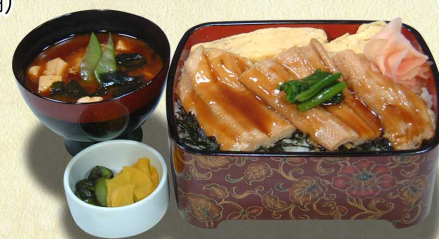
あなごうま煮重…1,680円 煮あなご一尾 だし巻き玉子 (税込1,848円)