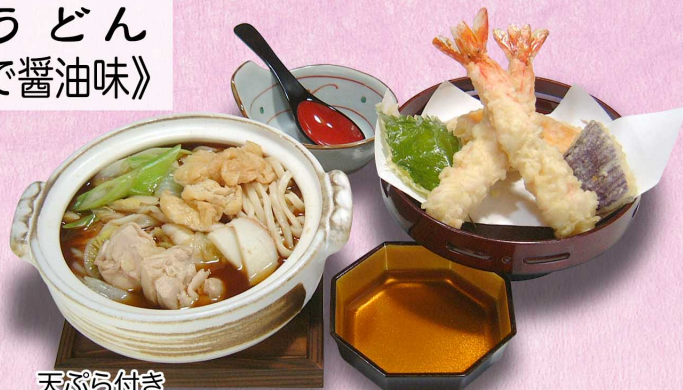
天ぷら付き 大えび天2本…2,140円(税込2,354円) 大えび天1本…1,810円(税込1,991円)