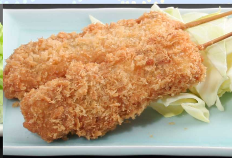
串かつ2本…550円(税込605円) 3本…790円(税込869円)