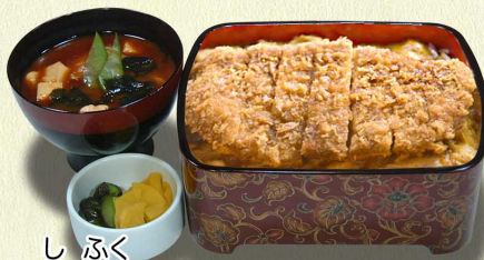
し ぶく 至福の ロースかつ重…1,280円 (税込1,408円)