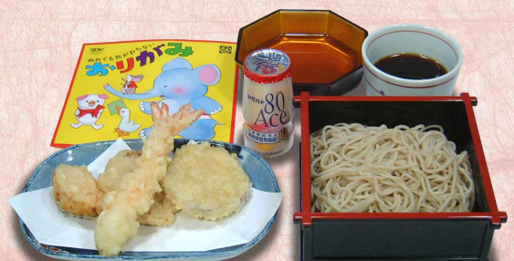
温冷 お子さま天ざる(おそば・うどん)...880円 (税込968円)