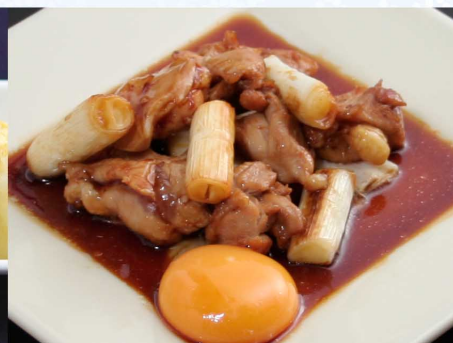
若鶏かえし焼き…780円 (税込858円)