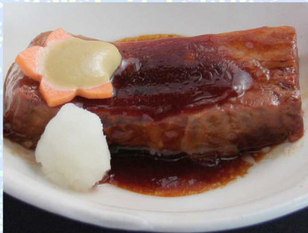
やわらか豚角煮…690円 (税込759円)