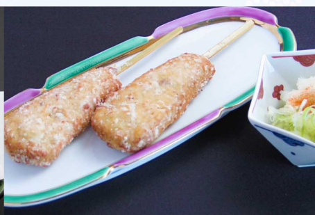
つくねおろし…500円(税込550円)