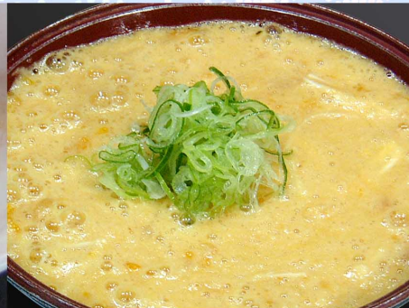
とろろステーキ…660円 (税込726円)