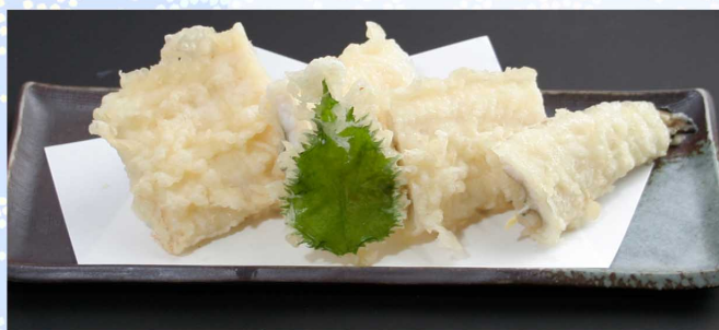
豪快あなご天ぶら…1,380円(税込1,518円)