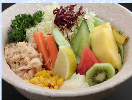
わか松サラダ…790円(税込869円)