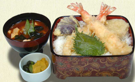
大えび天重…1,680円 大えび二尾、野菜 (税込1,848円)