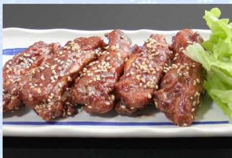
ピリ辛チキン…550円(税込605円)