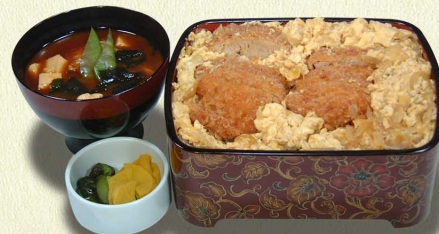
ヒレかつ重…1,280円 柔らかヒレカツ (税込1,408円)