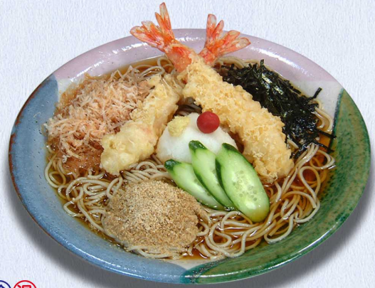
冷 えびおろしそば…1,760円(税込1,936円)

当店自慢のおそばは 北海道江丹別より毎日空輸で 送られてくるそば粉でお打ち いたしております 挽きたて、打ちたて、茹でたて 三たて のおそばの風味を十分 ご堪能下さいませ