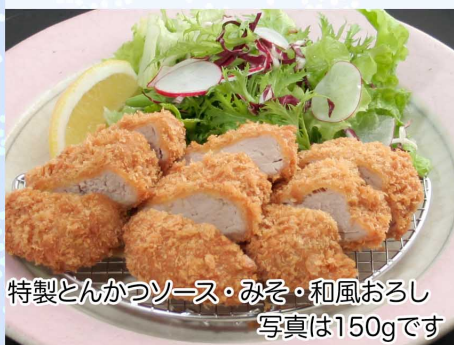
ヒレかつ150g…1,420円(税込1,562円) 100g…1,040円(税込1,144円)