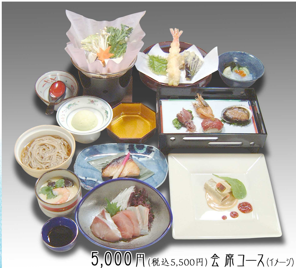
5,000円(税込5,500円) 会席コース(イメージ)

四季折々、旬の素材満載の会席料理をご用意いたしております ご予算に応じていかようにもご用意させていただきます お人数(20名様位迄)お料理の内容など何なりとご相談下さいませ