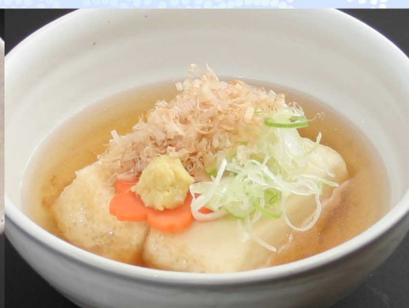
揚げ出し豆腐…550円(税込605円)