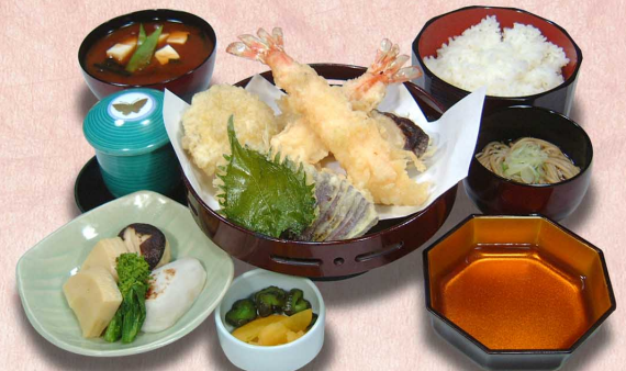
大えび天ぷら御膳(大えび2本)...2,190円 (税込2,409円) (大えび1本)...1,860円 (税込2,046円)