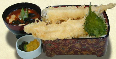
豪快あなご天重…1,750円 大きなあなごを豪快に一尾 (税込1,925円)