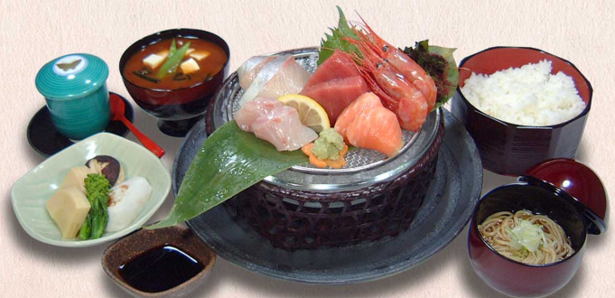
おさしみ御膳...2,190円 (税込2,409円)