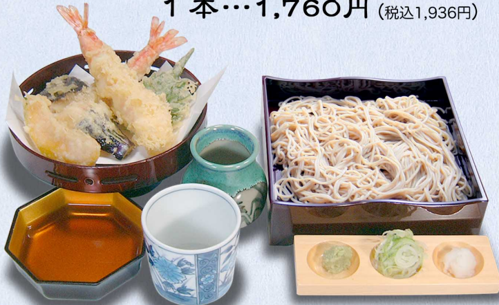
天箱そば 大えび天2本…2,090円(税込2,299円) 大えび天1本…1,760円(税込1,936円)

天箱そば 大えび天2本…2,090円 (税込2,299円) 1本…1,760円 (税込1,936円)