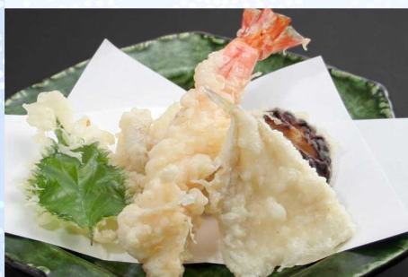
おつまみ天盛り…860円(税込946円) 野菜天盛り…780円(税込858円)