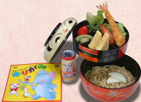
温冷 お子さまそば...880円 (税込968円)